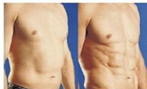
Antes y después de someterse un paciente al lipocontour

Un gran avance en este campo ha sido la introducción del láser en esta cirugía, lo que actualmente se denomina lipocontour . No sólo porque permite fundir la grasa antes de extraerla, sino porque también proporciona mayor firmeza cutánea al favorecer la retracción o estiramiento de la piel, y así evitar la posible flacidez que pudiera aparecer. Además, los resultados perduran más en el tiempo. "El lipocontour1440 nos permite ir más allá en cuanto a la mejora de los resultados. Hasta ahora, cuando realizábamos una lipoescultura, incidíamos principalmente en los cúmulos de grasa para modelar el contorno. Ahora, con el láser yag1440, también podemos trabajar con la elasticidad de piel y los tejidos subyacentes. Es decir, podemos conseguir que la piel se adapte mejor a la nueva silueta", explica el Dr. Ivan Mañero , cirujano plástico de IM CLINIC. Para que nos hagamos una idea más clara de este concepto, el doctor Mañero utiliza una analogía: "Imaginemos que el paciente tiene un pantalón de pijama antes de la cirugía y que ahora, una vez ha perdido el volumen, le viene grande. Esa goma representaría la piel. El lipocontour permite que la goma